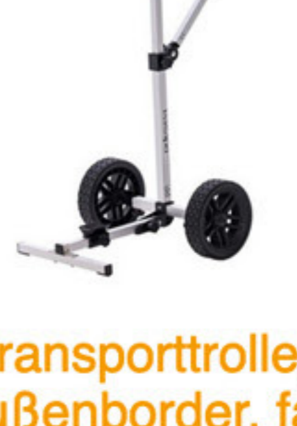
Transportrolley für Außenborder, faltbar 816004