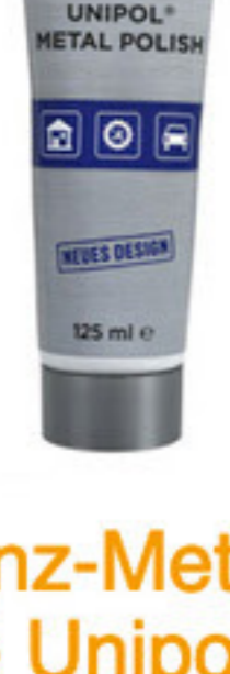
Hochglanz-Metallpolitur Paste Unipol blau 814851