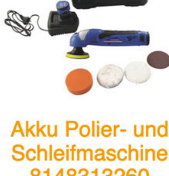
Akku Polier- und Schleifmaschine 8148313260

inkl. 2 Akkus, Ladegerät, Koffer und div. Pad's