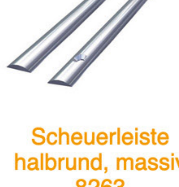
Scheuerleiste halbrund, massiv 8263

A4, in diverse Ausführungen erhältlich, 3 m