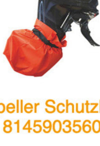
Propeller Schutzhülle 8145903560