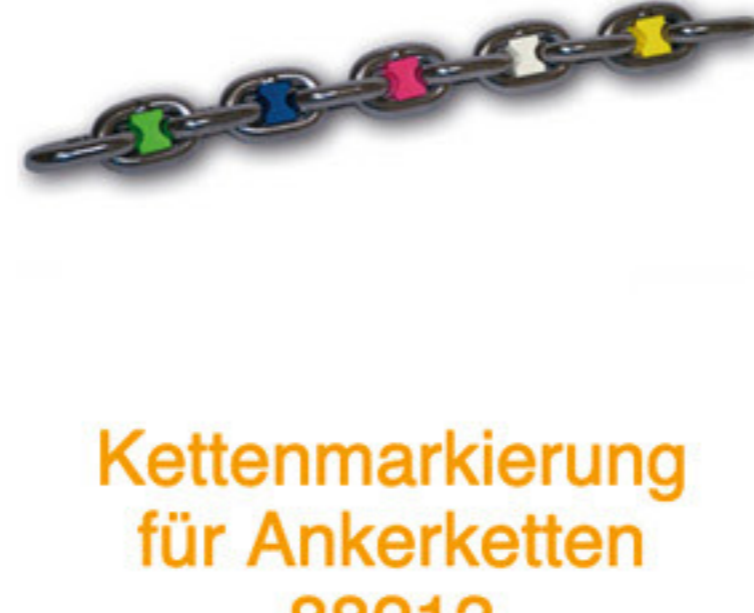
Kettenmarkierung für Ankerketten 88213